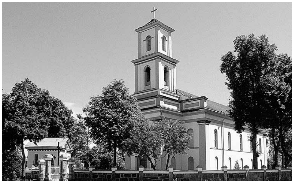
Nemenčinės šv. arkangelo Mykolo bažnyčia