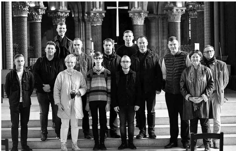
Vilniaus Aušros Vartų Gailestingumo Motinos atlaiduose

Visuomet laikausi nuomonės, kad muzi- kas (o juo labiau susijęs su bažnyčia), negali neišmanyti grigališkojo choralo. Daugelis žino, kad tai specifinis giedojimas, gyvavęs viduramžiais, tik ar jis aktualus šiandien? Tačiau grigališkasis choralas yra branduolys, kuriame glūdi visi bažnytinės muzikos raiškos principai. Ne taip, kaip daugumoje pasaulietinės vokalinės muzikos kūrinių, kuriuose žodinis tekstas gali gyvuoti at- skirai nuo melodijos, pagal savus principus. Choralo melodijos yra išaugusios iš žodžio. Vien gražiai atlikdami natas ir išgiedodami melodiją, giesmės neturėsime. Toks su- pratimas formuoja požiūrį, kuris iš esmės ►