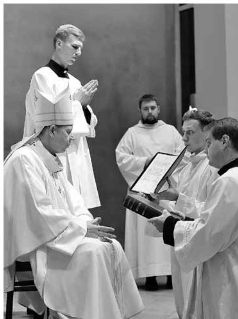
Lektoriams įteikiama Biblija