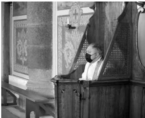
Išpažinčių klausymas gimtosios parapijos bažnyčioje