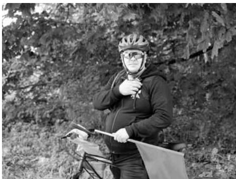
Nuolatinis jaunimo palydovas