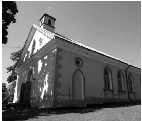
Siužionių šv. Felikso Valua bažnyčia

Mokiausiu Kauno kunigų seminarijoje 1992–1998 metais. Tuomet dar nebuvo mobilių telefonų. Pirmąjį nusipirkau prieš diakonatą, padariau sau dovaną. Ot, baisi plyta buvo... Nebuvo ir kompiuterių. Tiesą pasakius, buvo kažkokie, bet tikrai ne nešiojami. Tuomet Kauno kunigų seminarijoje mokėsi apie šimtas klierikų ir turėjome tik tris kompiuterius. Buvo ir visai kita atmosfera. Kai studijavau seminarijoje, buvo tik ką pasibaigęs Atgimimo laikotarpis, išlindome iš pogrindžio. Prieš tai parapijose buvę