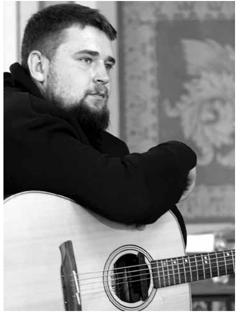
Poilsio akimirka su gitara rankose.

Taigi, jaunuolis Bažnyčioje turi jaustis visiškai laisvas, bet vis tik jam reikalingas suaugusių žmonių ir bendruomenės lyderių palydėjimas. Šis palydėjimas turi prasidėti šeimoje, o abi sielovados rūšys, šeimos bei jaunimo, turi būti neatskiriamos ir eiti greta viena kitos. Bendruomenė privalo priimti jaunuolius. Priimti juos tokiais, kokie jie yra, ir stengtis kiek įmanoma labiau juos suprasti ir palaikyti. Popiežius aiškiai pa-