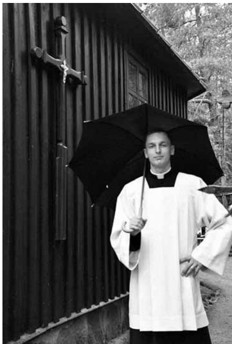
Panų Kalnas, Žemaičių Kalvarijos atilaidų išvakarėse

Galima teigti, kad pastoracinės veiklos „žvejybiniame tinkle“ meilės pagrindu tarpusavyje susiję visi aspektai: malda, meilė artimui ir gyvenimo pavyzdys. Pastoracinei meilei ir jos vystymuisi kenkia funkcionalizmas ir perdėtas rūpinimasis išoriniais dalykais. Pirmasis tarnystę paverčia atliekama funkcija, o antrasis maldą pastumia į šoną. ■